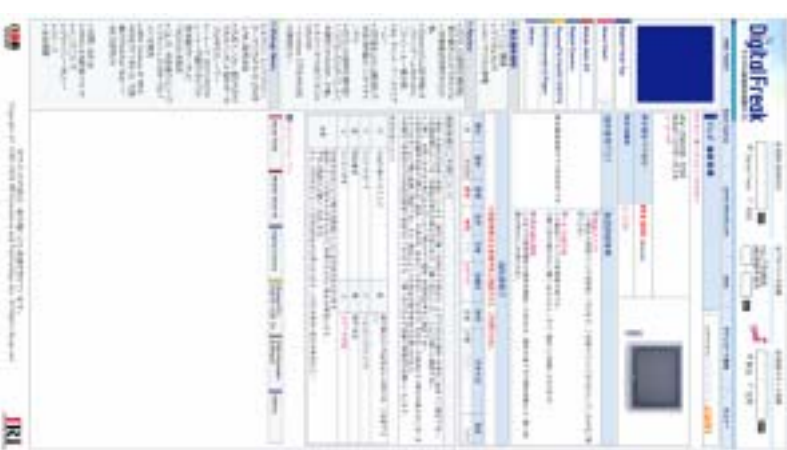
Digital Freak 画面写真(開発中のもの)。上よりトップページ、ニュース記事、価格リスト